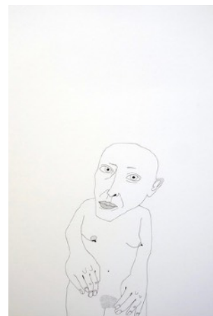
Portrait, 2021, Encre sur papier, 64,5x44,5cm

Institut finlandais est une plateforme indépendante et pluridisciplinaire entre la Finlande et la France. En collaboration avec différentes institutions internationales du milieu créatif, l'Institut finlandais propose un riche programme d'évènements culturels au sein de l'institut et hors de ses murs. À travers son programme, l'institut souhaite étudier comment participer à la promotion d'un discours international dans les domaines du design, de la mode, de la gastronomie, du cinéma et du spectacle vivant entre autres.