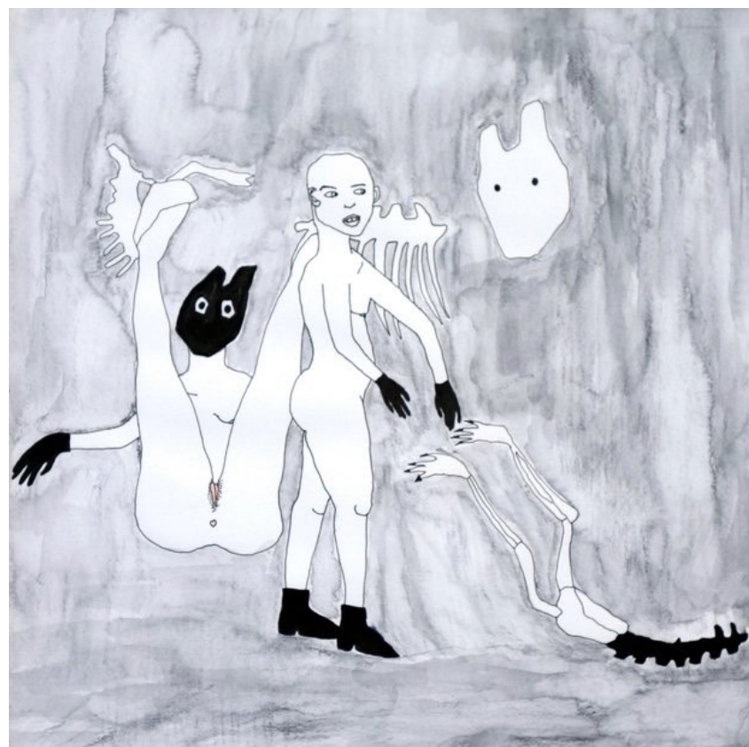
Sapwood, 2021, Aquarelle, encre, crayon et marqueur sur papier, 30x30cm