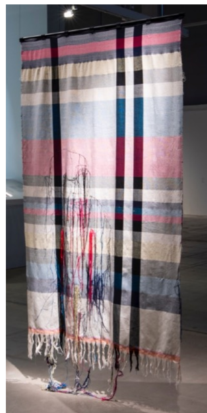
Work 1, 2021, Pièce tissée avec figure cousue à la main par l'artiste, coton, laine mérinos, 150x320cm