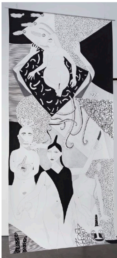
Howl 2, 2019, Marqueur, encre, crayon et gouache sur papier, 150x350cm